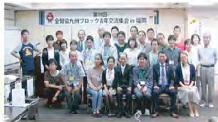
第19回 全腎協九州ブロック青年交流集会 I N福岡 集合写真