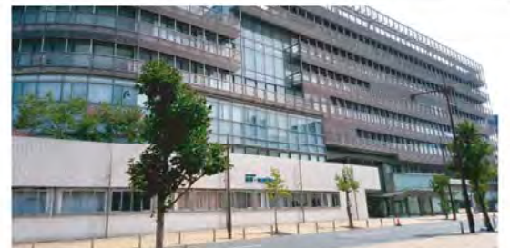
北九州市総合保健福祉センター(アシスト21)

●小倉北区の繁華街ですので、 お買い物のついでにお立ち寄 りください。 ●小倉北区馬借・北九州市立医 療センター隣です。 ●北九州市総合保健福祉セン ター(アシスト21)の1階、《福 祉用具プラザ北九州》の一角 にあります。