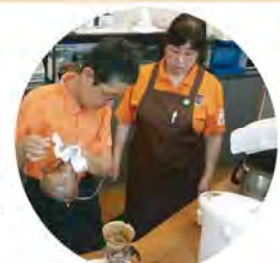
技術向上のため定期的に 研修を行っています

「喫茶やすらぎ」では一緒に働くスタッ フを募集しています。身体は元気なのに、 家から出ないという生活を変えてみたい方、 ぜひ一度遊びに来てください。