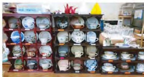
お好みのカップでコーヒーはいかがでしょう？