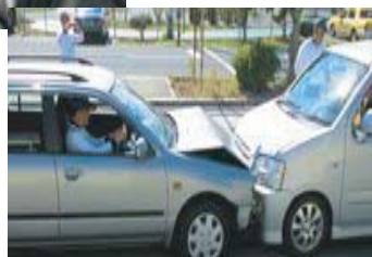
衝突の瞬間！ 危な～い(´Д`；)