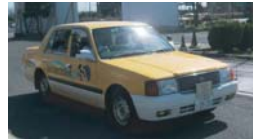
急ブレーキ体験 シートベルトは 絶対に必要！