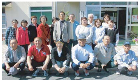
参加者全員で記念写真 笑顔で、はいチーズ！