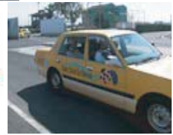
笑いが溢れた 講習でした！