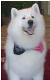
2代目 エンジェル君