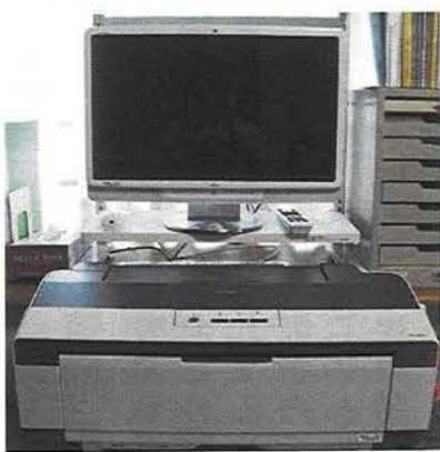
寄贈していただいたパソコン一式

今後、このパソコンは、「さわやか」新聞の発行や、事務管理等に大切に使用させていただきます。