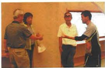
「さわやか」の理事長、2年連続で時間当てクイズでピタリ賞を当てたのにジャンケンで負けジ・エンド