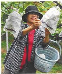
おいしいぶどうはどれかな?