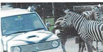
もしもしお兄さん エサくださ〜い!