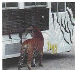
おいしいお肉をいただきます〜すウ・マ・イ