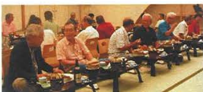
ボランティアさん同士で、食事をしながら・・・チョッピリお酒も入り、話に花が咲く!?