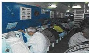
魚たくさんいるかな？