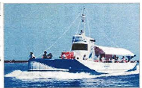
半潜水型海中展望船「ジーラ」 青ジーラとピンクジーラがあります

今回は、二丈浜玉有料道路から目的地の海中展望船「ジーラ」に乗るためにバスが止まり、運転手さんがサイドブレーキを引いたところまでの時間を当てるクイズを行いました。