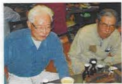
ボランティア仲間であり呑みともたち