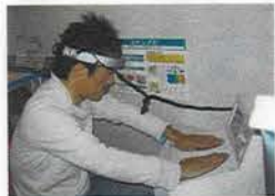
「ストレス」たまってる〜?