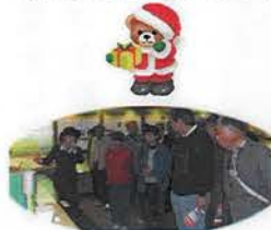
説明を真剣に・・・