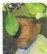
なにを覗いているの?