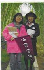
味の素の工場見学のガイドさんとハイチース