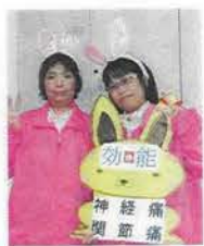
古ギャルとギャル!