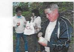
いつもやらされてま〜す